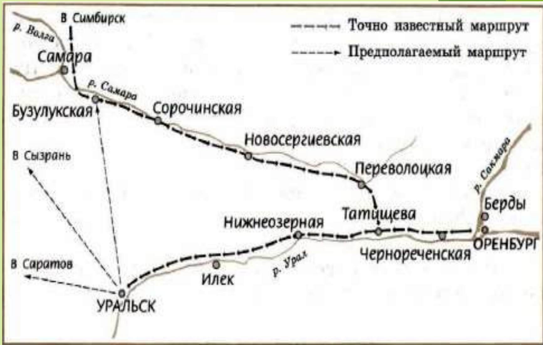
Карта - схема путешествия А.С.Пушкина из учебника Коровиной «Литература» 8 класс часть 1