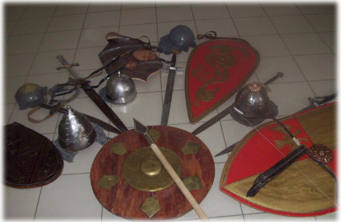
Фото 4. Разновидности щитов.