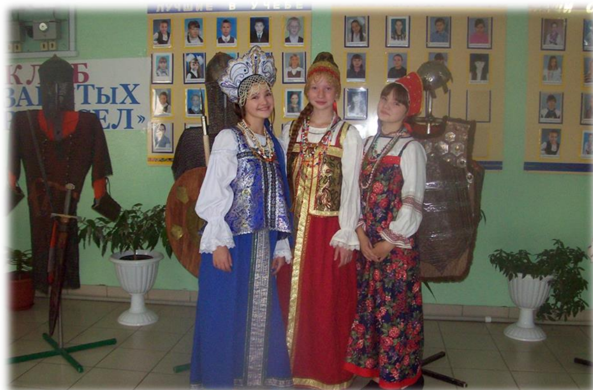
Фото 1. Члены клуба «Кустари» в народных костюмах