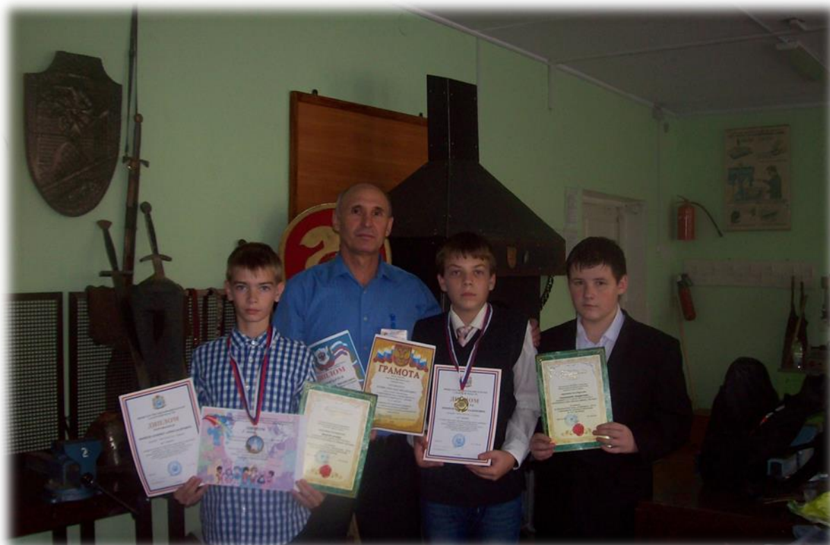
Фото 12. Результаты участия в конкурсах различного уровня