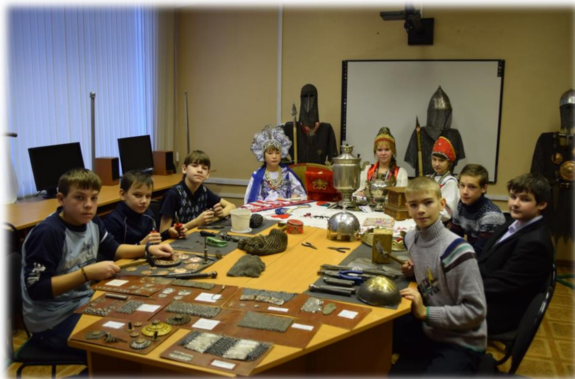
Фото 10. Члены клуба «Кустари».