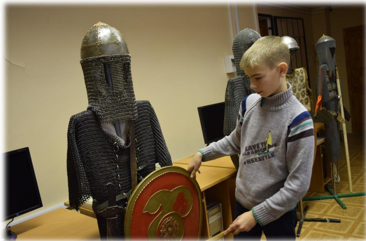
Фото 7. Выставка «Музея забытых ремесел».