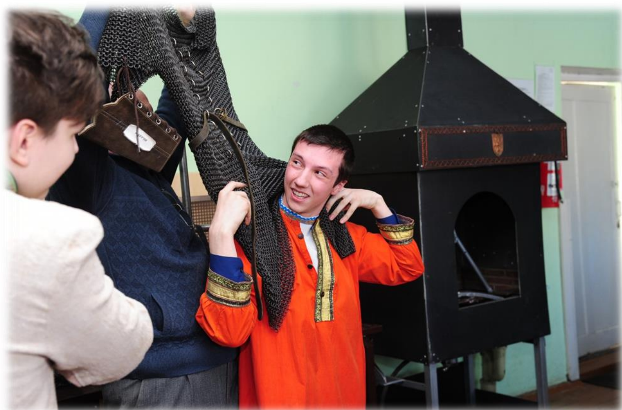
Фото 5. Облечение в кольчугу.