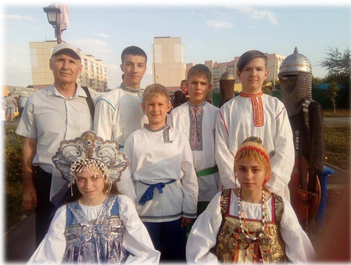
Фото 11. Городской праздник иконы Донской божьей матери.