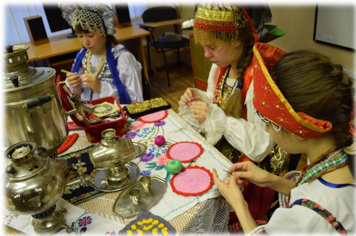
Фото2. За работой.