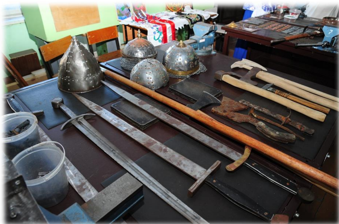
Фото 6. Выставка «Музея забытых ремесел».