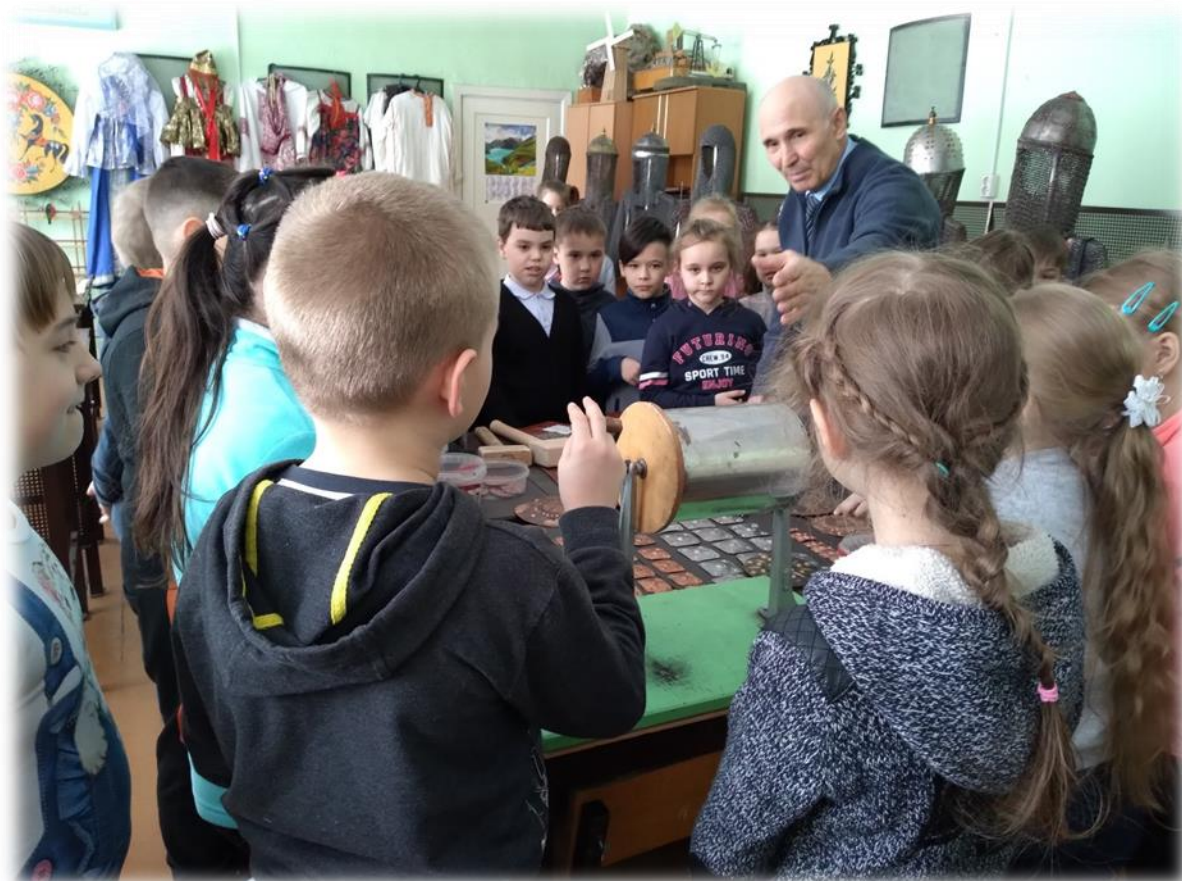
Фото 9. Барабан для очистки заготовок - галтель.