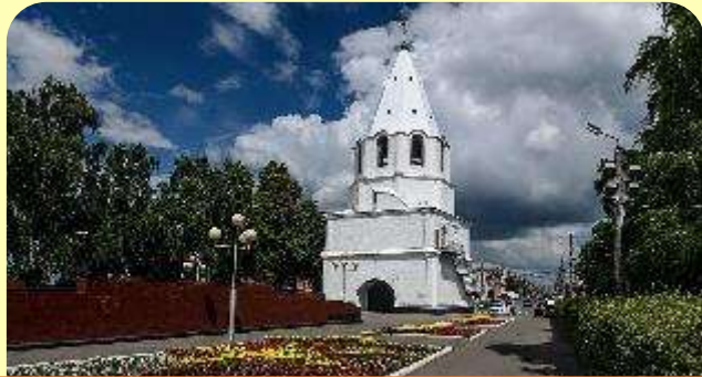
1. Сызранский Кремль