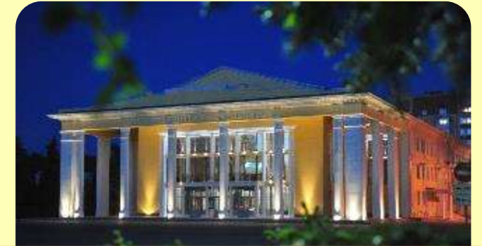
4. Драматический театр