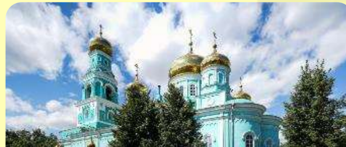
3. Кафедральный собор