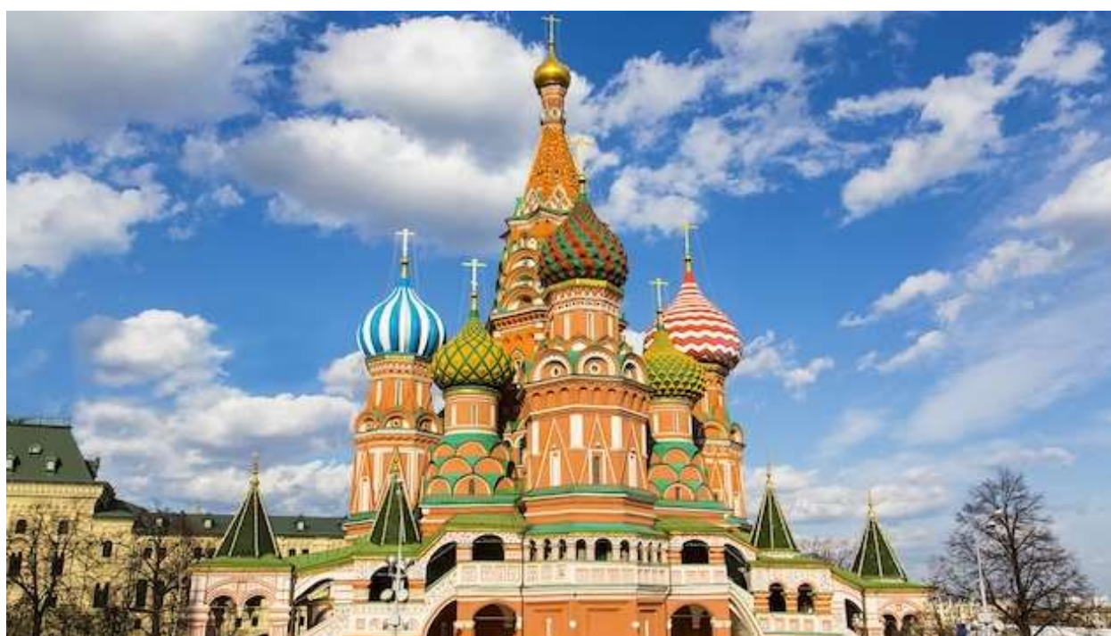
St. Basil's Cathedral is a brightly colored landmark in Moscow.