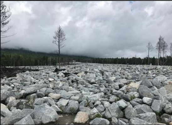
Глыбы селевого потока